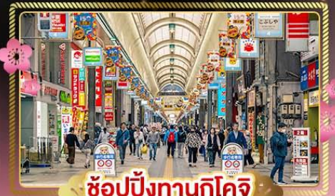
ช้อปปิ้งทานุกิโจจิ