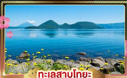
ทะเลสาบโทโยะ

ชมวิวซากุระบนยอดหอคอยสูง 107 เมตร Goryokaku Tower