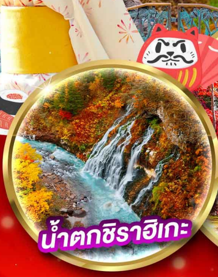
น้ำตกชิราอิเกะ