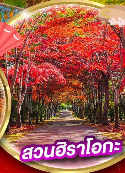
สวนชิราโอกะ