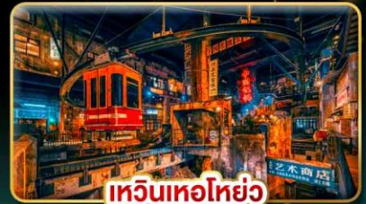
เหวินหนอหยั่ว