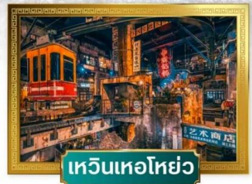
เหวินเหอโฮ่ว

เดินทางโดย : สายการบินโลออนแอร์ อาหาร : 13 มื้อ โรงแรม : 4 ดาว