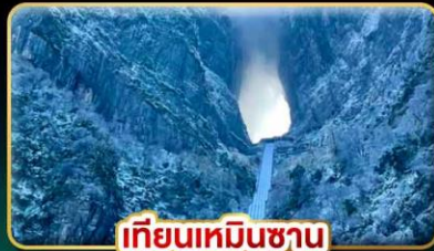
เทียนเหมินชาน