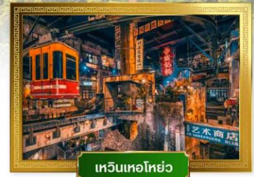
ฟู่หรงเจิน