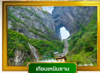
เกียนเหมินซาน