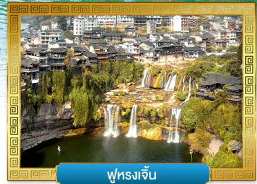
ฟูรงจิ้น