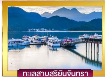
ทะเลสาบสุริยนจินทรา