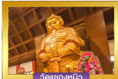
วัดแซงกทมิว