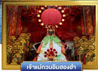
เจ้าแม่กวนอิมองค์ห้า