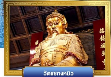
วัดเซกวงหมิว