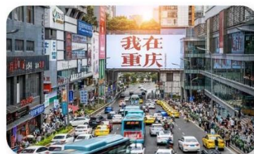
ถนนอาหารกวนอันเฉียว