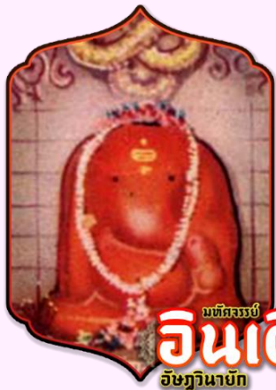
มณฑลจรรยา อินเดียน อิชฏินายัก

โทรศัพท์ : 042-246662 / 086-4515274 E-mail : journeyticket@hotmail.com