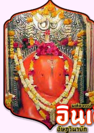
มณฑลจรรยา อินเดียน อิชฏินายัก