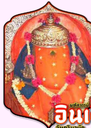
มณฑลจรรยา อินเดียน อิชฏินายัก