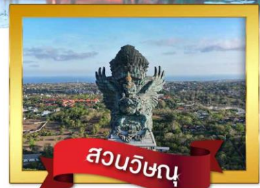
สวนวิษณุ