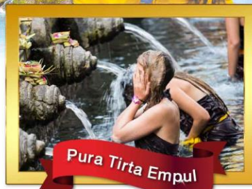
Pura Tirta Empul