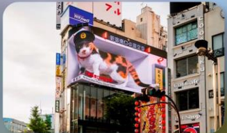
ช้อปปิ้งซินจุกุ