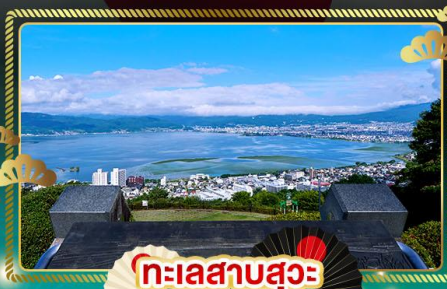
ทะเลสาบสุวะ