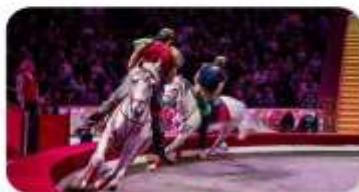
โชว์ละครส์คัว