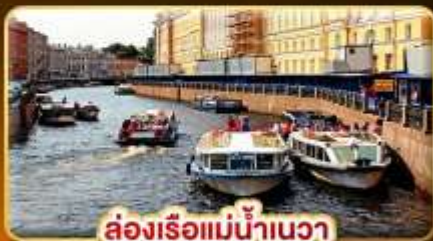
ล่องเรือแม่น้ำนาวา