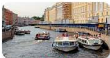
ล่องเรือแม่น้ำเนวา