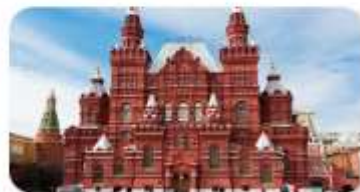
จักรีสแดง