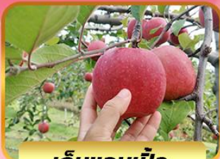
เก็บแอปเปิ้ล