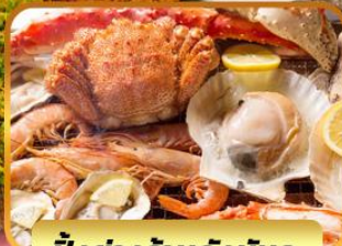
ปิ้งย่างร้านดังนินตะ