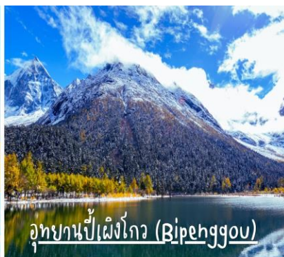
อุทยานบีเฟิงโกว (Bipehggou)