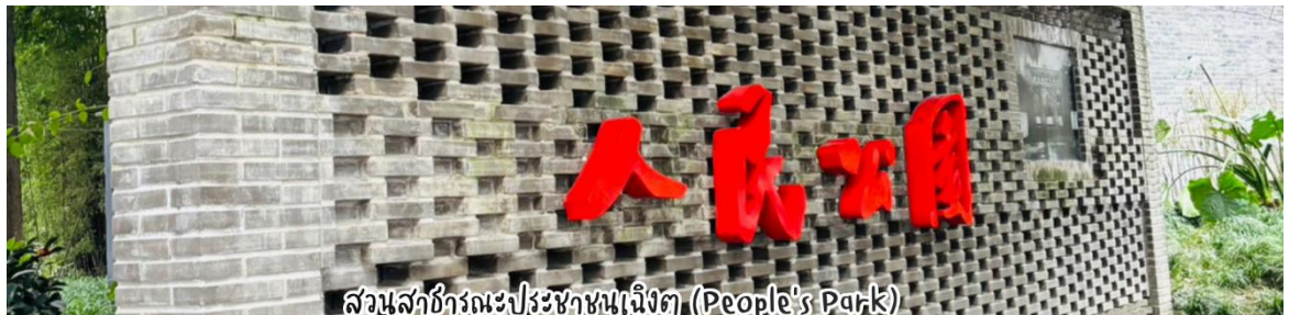
สวนสาธารณะประชาชนเฉิงตู (People's Park)

จากนั้นนำท่านเดินทางสู่ สวนสาธารณะประชาชนเฉิงตู (PEOPLE PARK) ตั้งอยู่ใจกลางเมืองเฉิงตู มณฑลเสฉวน เป็นสวนสาธารณะที่สร้างขึ้นในปี 1911 สัมผัสวิถีชีวิตของคนท้องถิ่นที่เรียบง่าย ชมวิถีชีวิตชาวเมืองออกมาเดินรำ รำไทเก๊ก เล่นหมากรุก ร้องเพลง เหมาะสำหรับมานั่งพักผ่อนและสัมผัสวัฒนธรรมท้องถิ่น มีโรงน้ำชาเก่าแก่ไว้นั่งพักผ่อนจิบชาชิลล์ๆ อนุสาวรีย์การเคลื่อนไหวปกป้องทางรถไฟ และไฮไลท์ของที่นี่นั่น “โซนหาคู่” ด้านในสวน จะมีป้ายประกาศคุณสมบัติของหนุ่มสาวที่อยากหาคู่เรียงรายยาวสุดทาง