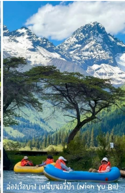
ล่องเรือยาง เหนียนฮอวีป่า (Nian Yu Ba)