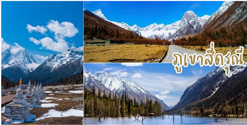
ภูเขาสี่ดรุณี สวิตเซอร์แลนด์แห่งแดนมังกร ภูเขาสี่ดรุณี หรือ ชื่อในภาษาจีน ชื่อกู่เหนียงซาน (四姑