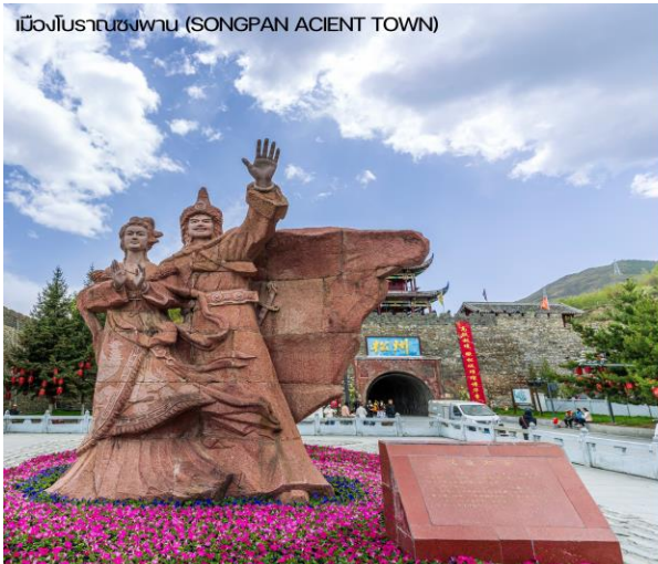
เมืองโบราณซงปาน (SONGPAN ACIENT TOWN)

นำท่านแวะเที่ยวชม ทะเลสาบเต๋อซี (DIXI LAKE) ตั้งอยู่เหนือระดับน้ำทะเลถึง 3,000 เมตร เป็นทะเลสาบสีเขียว เทอร์คอยซ์ แต่เลื่อยยาวไปตามแอ่งหุบเขา เป็นภูมิภาพอันยิ่งใหญ่ตระการตาผืนดาราบเรียบ ปราศจากริ้วคลื่น หรือ แห่งตอไม้ และสีของทะเลสาบเข้มสดไร้เงาสะท้อนจนดูราวเป็นกระเบื้องยาว ทะเลสาบเต๋อซี เป็นผลพวง จากการเกิด แผ่นดินไหวเมื่อปี พ.ศ. 2478 ซึ่งคราวนั้นได้กลืนสิ่งก่อสร้าง และทุกสรรพชีวิตให้หายไปไนพริบตา ความงามของ ธรรมชาติบางครั้งก็แฝงด้วยความโหดร้าย อิสระให้ท่านพักผ่อนอิริยาบถ หรือถ่ายรูปคู่กับจามรีสีชาวมัดกับฟ้าสี ครามและน้ำสีเขียวมรกต