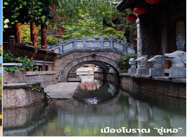
เมืองโบราณ "ซูเหอ"