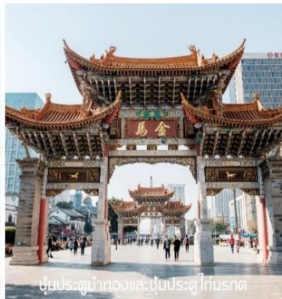
ซุ้มประตูม้าทองและซุ้มประตูไก่อมรกต