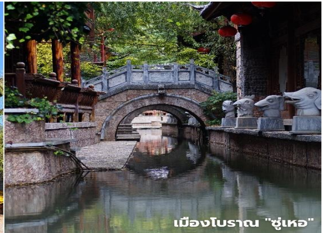
เมืองโบราณ "ชู่เหอ"