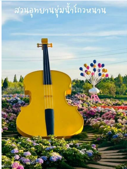
สวนอุทยานชุ่มน้ำโกเวนนาน