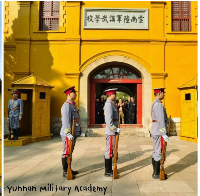
Yunhai Military Academy

จากนั้นนำท่านช้อปปิ้ง Kunming Old Street เมืองเก่า ที่อยู่ใจกลางเมือง Kunming อาคารไม้สีดำ สีน้ำตาล ผนัง กำแพงอาคารคุมโทนสีเดียวกัน Kunming Old Street