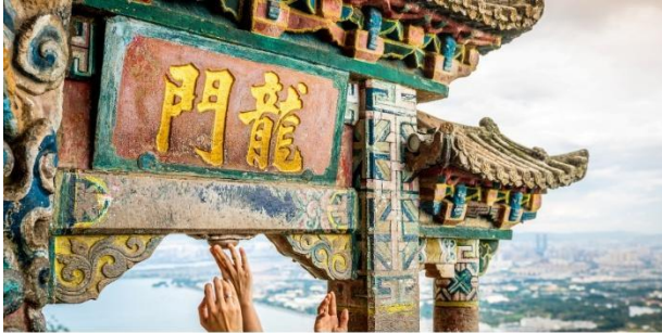
เขาสีซาน (Xishan Mountain)

ชมวิวยามพระตมั่งกร คุณสามารถมองเห็นวิว ทะเลสาบเตียนฉือ (Dianchi Lake) ที่กว้างใหญ่และตัวเมืองคุนหมิงได้แบบ 360 องศา