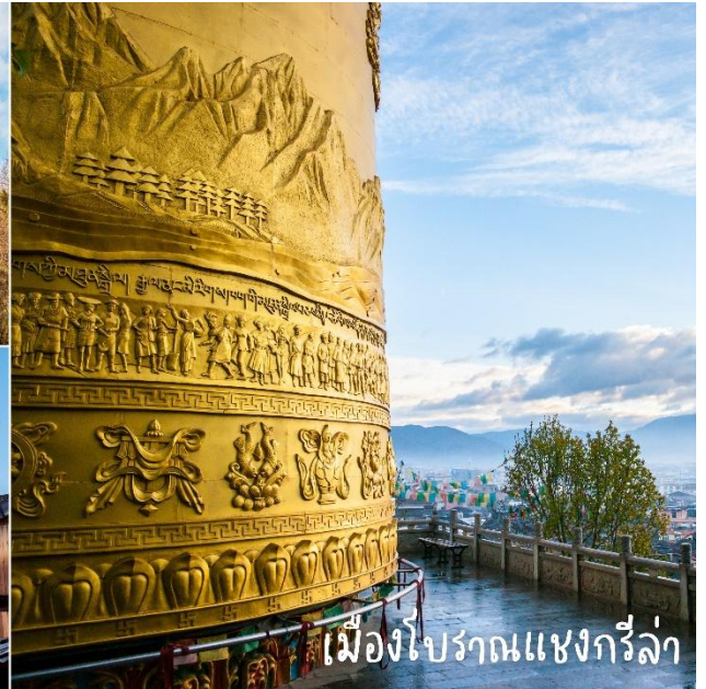
เมืองโบราณแซงกรี่ล่า