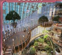
ห้างการค้าเดินถ่วงหวน