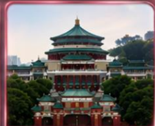
ศาลาประชาคม (ชมด้านนอก)