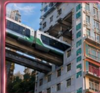
นั่งรถไฟทะลุคิก 2 สถานี