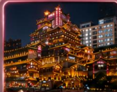
ชมแสงสีหงหยาดัง