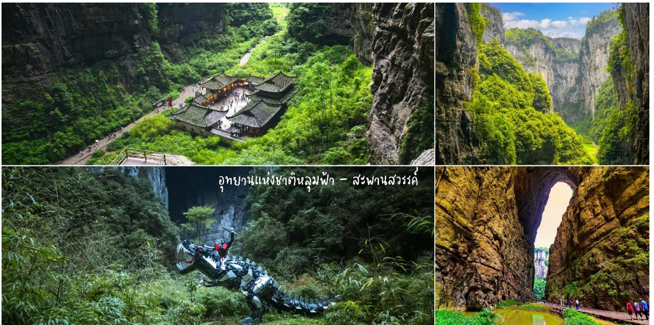
อุทยานแห่งชาติหลุมฟ้า - สะพานสวรรค์

นำท่านเดินทางสู่ อุทยานแห่งชาติหลุมฟ้า - สะพานสวรรค์ มรดกโลกทางธรรมชาติ ระดับ 5A ที่เกิดจากการยุบตัวของเปลือกโลก ทำให้เกิดเป็นบ่อหลุมขนาดใหญ่ที่ลึกประมาณ 300-500 เมตร และมีบางส่วนเป็น โพลงทะเลเหมือนกับสะพานทอดข้ามระหว่างภูเขา ภายในอุทยานแห่งชาติหลุมฟ้า - สะพานสวรรค์ ยังมีโรงเตี๊ยมเก่าๆ ซึ่งเป็นจุดแวะพักของคนเดินทางในสมัยก่อนตั้งแต่ในสมัยราชวงศ์ถัง (ค.ศ. 618-907) และจุดนี้เองที่จางอีโหมว ใช้เป็นฉากในหนังการถ่ายทำหนังเรื่อง "ศึกโค่นบัลลังก์วังทอง" ล่าสุดใช้เป็นฉากในหนังฮอลลีวูดฟอร์มยักษ์ TRANSFORMER4 ที่โด่งดังไปทั่วโลก นำท่านสัมผัส สะพานแก้วสวรรค์ หรือระบียงกระจอกชมวิวย ออกแบบโดยผู้เชี่ยวชาญทั้งในและนอกจีน ตั้งอยู่ 11 เมตรเหนือขอบหน้าผาสูงในเมืองเซียนหนู่ชาน กว้างอีก 26 เมตร