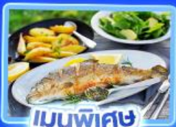
เมนูพิเศษ ปลาเทราต์ย่าง

อัลสส์ตัทท์ เวียนนา อินส์บรุค ปราสาทนอยชวานสไตน์ ลูเซิร์น ริก