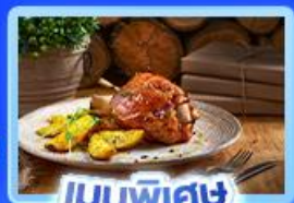
เมนูพิเศษ ขาหมูเยอรมัน