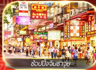
ช้อปปิ้งจิมซาจуй