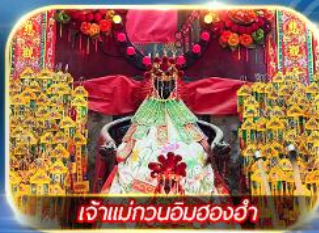
เจ้าแม่กวนอิมฮ่องฮำ