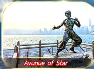
Avunue of Star