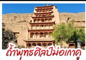
กำแพงมรดกโลกม่อเกาตู

เป็นทรายคงกฤษ - สระน้ำวังพระจันทร์ ทะเลสาบเกลือฉางช่า - กำแพงมรดกโลกม่อเกาตู หุบเขาสายรุ้งจางเย่ - ทะเลสาบชิงไห่